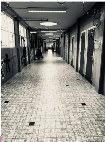
Rick Smolders – 15 december 2017 Een mooie zwart-wit foto waarbij nog net te zien is dat er leerlingen bezig zijn met de muurschilderingen in de gang. Wat een mooi perspectief!